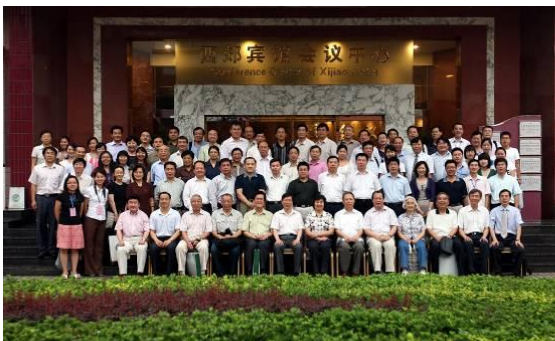
庆祝《语言教学与研究》创刊三十周年学术研讨会